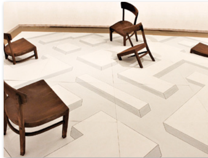
Günter Wagner Ansicht der Installation Ruhelos im Hans Thoma Museum in Bernau, 2019, 600 cm x 450 cm, eisenbeschichtetes und patiniertes Holz bemalte Kartonplatten