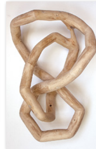
Alexander Habisreutinger Ohne Titel, 2018, 34 x 50 x 25 cm, Astskulptur, Hainbuchenholz