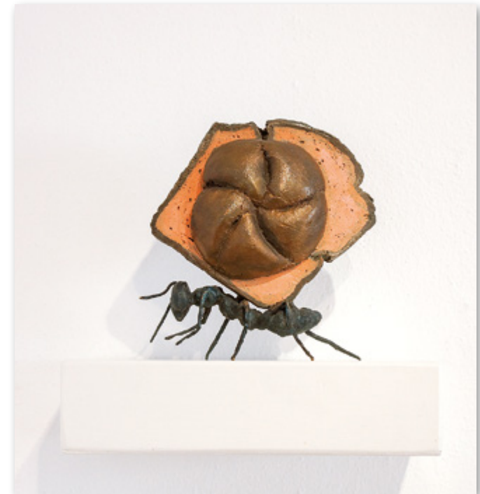
Reiner Schlecker LKW, 2019, 17 x 17 x 17 cm, Bronze

Vom Überfluss der Erzählungen Reiner Schlecker ist zwischen allen Kunstgenres unterwegs. Von der Performance, der Installation, bis hin zur Objektkunst und zum traditionellen Ölbild arrangiert und inszeniert er seine Kunstaktionen. In amüsant humoristischer bis absurd- dadaistischer Weise umkreisen seine Arbeiten die Welt und Neugier des Provinzlers. Soll sie zünden, so hat sich die Kunst an einer Wirklichkeit zu reiben, mit der nicht zimperlich umgegangen werden muss! Wo gehobelt wird, da fallen Späne, so ist das nun mal, so sein künstlerisches Credo.